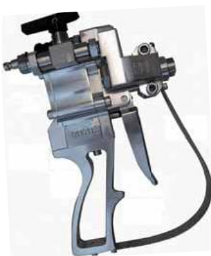
FUTURA FT3 ad alta pressione (optional)