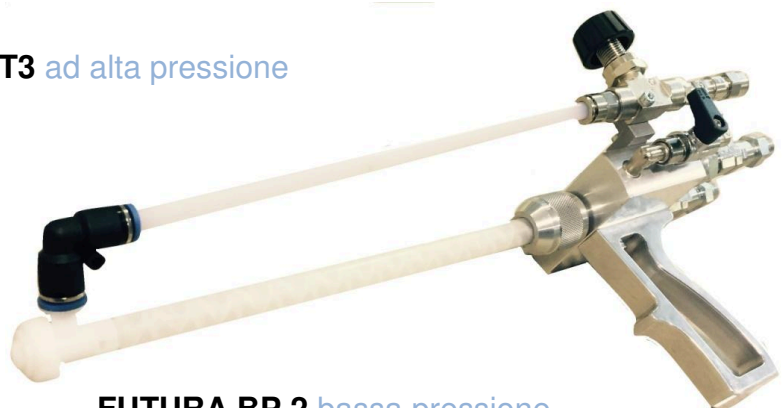
FUTURA BP 2 bassa pressione (in dotazione)